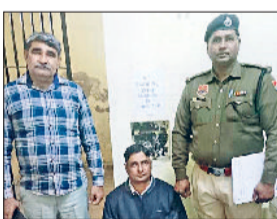
रेवाड़ी। पीओ स्टाफ के तहत गिरफ्तार किया गया आरोपी।