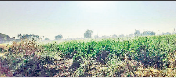
रेवाड़ी। सरसों की फसल में फव्वारा सिस्टम से की जा रही सिंचाई।

साफ बना रहा है। रात के तापमान में गिरावट के बावजूद दिन का तापमान सामान्य से अधिक बना हुआ है। रात के तापमान में गिरावट से सुबह और शाम के समय ढंड का असर देखने को मिल रहा है। आसमान साफ होने के कारण सूरज की तपिश दोपहर तक ढंड के असर को पूरी तरह खत्म कर देती है। बुधवार को अधिकतम 1.2 डिग्री सेल्सियस बढ़कर 26.2 डिग्री पर पहुंच गया। न्यूनतम तापमान 0.7 डिग्री की गिरावट के साथ 5.5 डिग्री सेल्सियस पर आ गया। दिन का तापमान सामान्य से चार डिग्री तक ज्यादा चल रहा है। हवाओं की रफ्तार मंद पड़ने से शीत