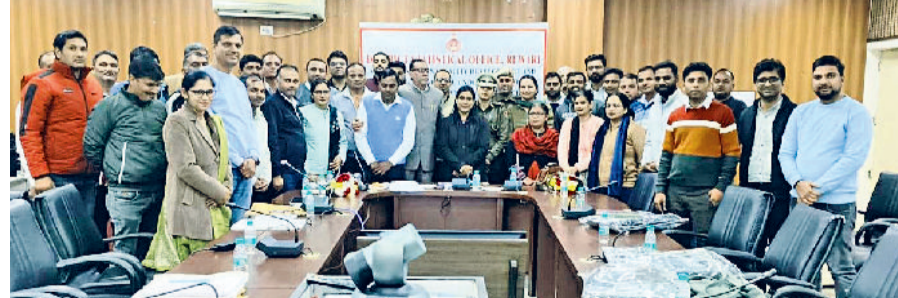
रेवाड़ी। कार्यक्रम में भाग लेने वाले प्रशिक्षु अधिकारियों के साथ।