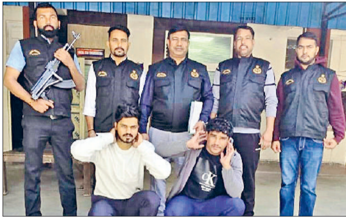
रेवाड़ी। हॉटस्पॉट अभियान के तहत काबू किए गए आरोपी।