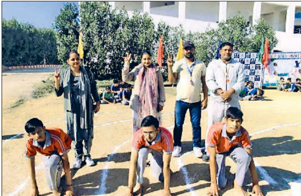
रेवाड़ी। प्रतियोगिता में भाग लेते स्कूल के बच्चे।

महेन्द्रगढ़ रोड स्थित वीआईपी स्कूल में चार दिवसीय वार्षिक खेलकूद प्रतियोगिता का सफलतापूर्वक आयोजन किया गया। प्रतियोगिता में नर्सरी से लेकर कक्षा 12 तक के विद्यार्थियों ने उत्साहपूर्वक हिस्सा लिया और विभिन्न खेलों में अपनी प्रतिभा का प्रदर्शन किया। इस चार दिवसीय खेल महोत्सव ने यह साबित कर दिया कि वीआईपी स्कूल के विद्यार्थी सिर्फ पढ़ाई में ही नहीं, बल्कि खेल मैदान में भी उत्कृष्ट प्रदर्शन करने की क्षमता रखते हैं। बच्चों ने जीत और हार से ऊपर उठकर खेल भावना, अनुशासन,