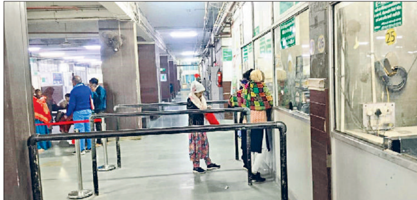
रेवाड़ी। सूना पड़ा सामान्य अस्पताल की ओपीडी स्लैप का काउंटर।