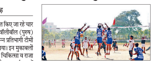
महेंद्रगढ़। प्रतियोगिता में दमखम दिखाते खिलाड़ी।

हरियाणा केंद्रीय विश्वविद्यालय में आयोजित किए जा रहे चार दिवसीय उत्तर क्षेत्र अंतर-विश्वविद्यालय वॉलीबॉल (पुरुष) प्रतियोगिता 2025-26 के दूसरे दिन विभिन्न प्रतिभागी टीमों के द्वारा रोमांचक खेल का प्रदर्शन किया गया। इन मुकाबलों की शुरुआत गुरु अमंद देव पशु विज्ञान एवं चिकित्सा व राजा महेंद्र प्रताप सिंह विश्वविद्यालय अलीगढ़ के साथ हुई। इसमें राजा महेंद्र प्रताप सिंह विश्वविद्यालय, अलीगढ़ की टीम में बाजी मारी। इसी क्रम में प्रतियोगिता के दूसरे दिन महर्षि दयानंद विश्वविद्यालय (एमडीयू) रोहतक व चण्डीगढ़ विश्वविद्यालय मोहाली के बीच हुए मुकाबले में चण्डीगढ़ विश्वविद्यालय मोहाली, चौधरी देवीलाल विश्वविद्यालय सिरसा व गुरु गोविंद सिंह इंद्रप्रस्थ यूनिवर्सिटी दिल्ली के बीच हुए मुकाबले में चौधरी देवीलाल विश्वविद्यालय सिरसा, मानव रचना इंटरनेशनल इंस्टीट्यूट ऑफ रिसर्च एंड स्टडीज फरीदाबाद व डॉ. भीमराव अम्बेडकर विश्वविद्यालय आगरा के बीच खेले गए मैच में मानव रचना इंटरनेशनल इंस्टीट्यूट