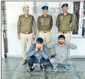
रेवाड़ी। फायरिंग करने के आरोपी पुलिस टीम के साथ।

मंगलवार की रात अर्जुन नगर में उस समय लोगों में हड़कंप मच गया, जब पहले परिवार के सदस्यों के साथ मारपीट करने के बाद महिला पर फायरिंग कर दी गई। फायरिंग में महिला बाल-बाल बच गई। सूचना मिलने के बाद मौके पर पहुंची सिटी पुलिस ने दो आरोपियों को गिरफ्तार कर लिया। विजय नगर निवासी