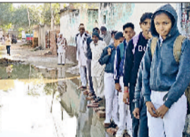
रेवाड़ी। नैनसुखपुरा के रास्ते में एकत्रित पानी के पास खड़े स्कूली बच्चे।